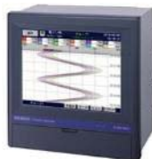
グラフィックレコーダ 記録+水分・厚さ計用演算対応