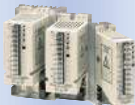
単相サイリスタレギュレータ JB series