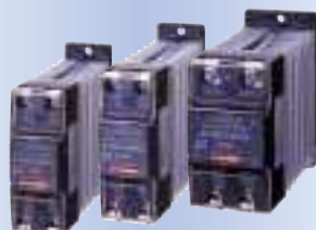
ソリッドステートリレー JZ series