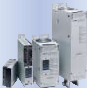
単相サイリスタレギュレータ JU series