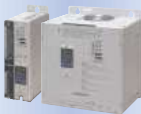
三相サイリスタレギュレータ JW series